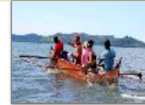
Viaggio in piroga

Passando dalle mangrovie esistenti con la piroga arriverete su una spiaggia con un piccolo rinfresco. Da qui, a piedi e con una guida esperta vi inoltrerete tra palme e piante medicinali alla ricerca delle diverse specie animali che popolano la foresta rane, camaleonti più piccoli al mondo, lemuri, boa constructor e uccelli vari.