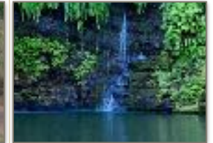
Cascata Sacra Nosy Be