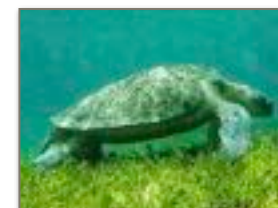
la tartaruga verde gigante

L'isola presenta bellissime calette e vi offrirà l'esperienza unica di nuotare con le tartarughe verdi giganti in un luogo particolare chiamato « La piscina ».