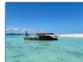
L'acqua cristallina di Nosy Iranja

Nosy Iranja, una delle isole più belle al mondo, offre uno dei paesaggi più suggestivi. Iranja Be e Iranja Kely sono collegate da una lunga lingua di sabbia bianca fine. Grazie al fenomeno della marea è possibile fare una piacevole passeggiata. In cima ad Iranja Be oltre ad esserci diversi punti panoramici è presente un faro costruito da Gustavo Eiffel.