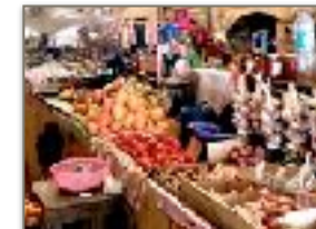
Il mercato di Hell Ville

Una mezza giornata folkloristica nella capitale di Nosy Be. Hell Ville, città colorata e profumata, shopping tra piccoli Bazar per poter comprare simpatici souvenir visitare il coloratissimo mercato ricco di odori tra cui, pepe, zenzero, zafferano. Visita all'Albero Sacro, importante culto per la religione animista. Entrerete all'interno di questo Ficus di circa 5 mila mq con tipici abiti malgasci, una vera esperienza malgascia!