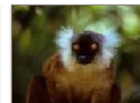
Lemure Macaco femmina Nosy Komba