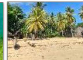
La spiaggia di Sakatia