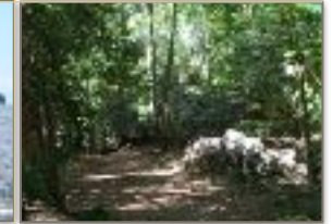
La foresta di lokobè