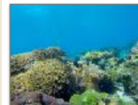
Fondale marino Nosy Tanikely

Le isole più belle dell'arcipelago. Nosy Tanikely parco marino, la più piccola delle isole, ma offre uno dei fondali più ricchi e spettacolari, sul quale avrete la fortuna di fare uno snorkeling guidato e rilassarvi in spiaggia. Poi l'isola di Nosy Komba, famosa per l'artigianato locale e la presenza dei simpaticissimi lemuri Macaco.