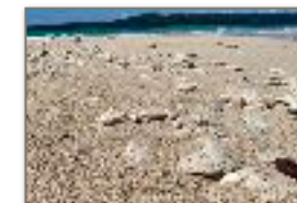
Coralli e conchiglie Nosy Fanihy